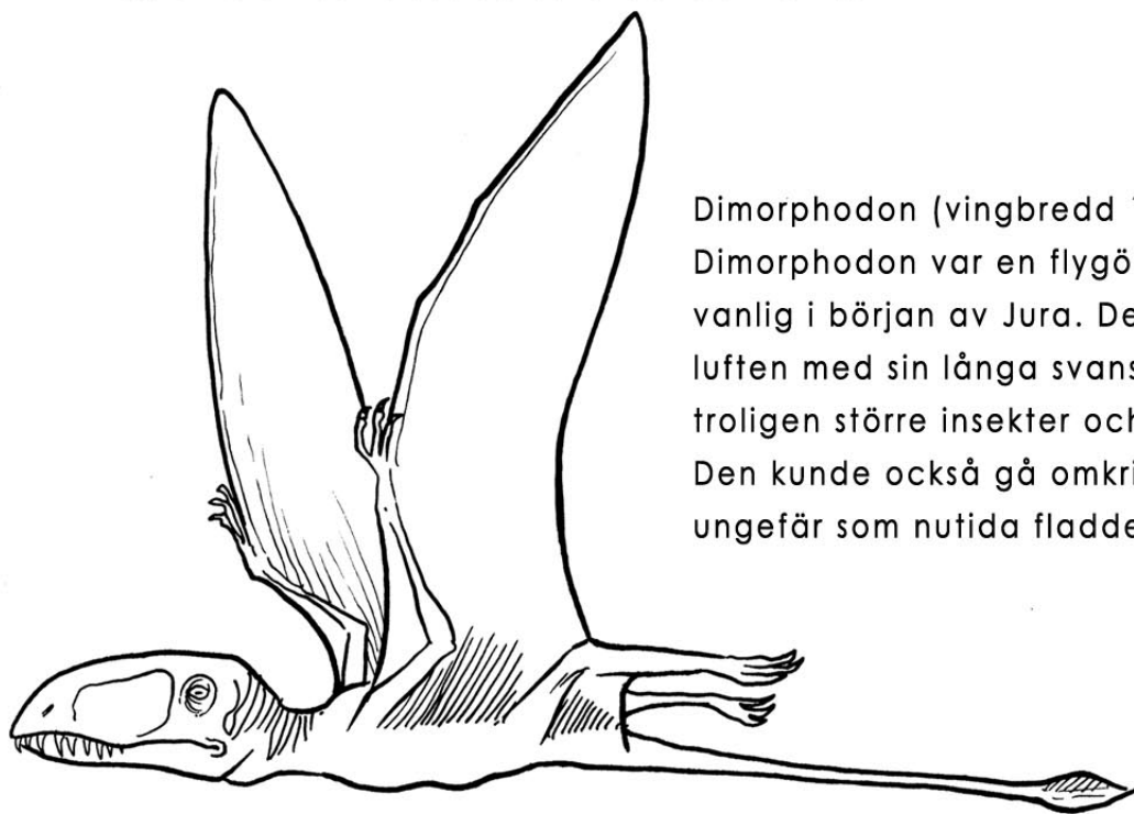
Dimorphodon (vingbredd 1,5 m)

Under jura utvecklades dinosaurierna i en massa arter. Det varma, fuktiga klimatet skapade både sumpmarker och stora skogar. Det fanns gott om mat för växtätarna. De köttätande dinosaurierna blev därför också talrika. Några växtätare blev enormt stora, som sauropoderna. Deras storlek var ett skydd mot rovdinosaurierna. Andra växtätare utvecklade skydd i form av kroppspansar, horn och taggar. Flygödlor och havslevande reptiler gick framåt under Jura. De första primitiva fåglarna utvecklades också under denna tid.