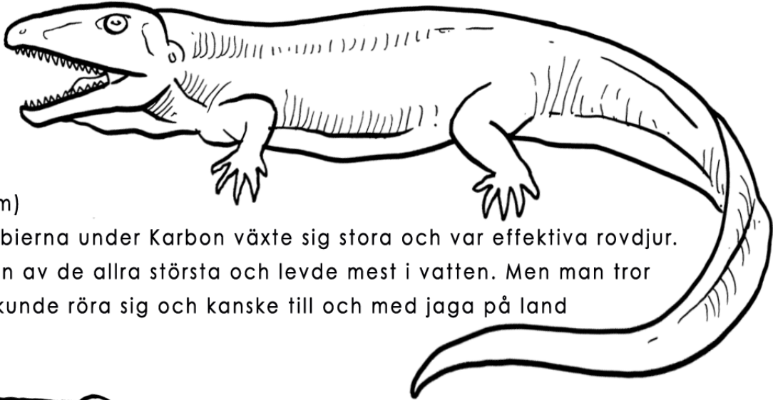
Eogyrinos (4,6 m)

Pederpes var ett landlevande djur på väg från fisk till amfibie i utvecklingen. Den är det tidigaste helt landlevande fyrfota djur man känner till.