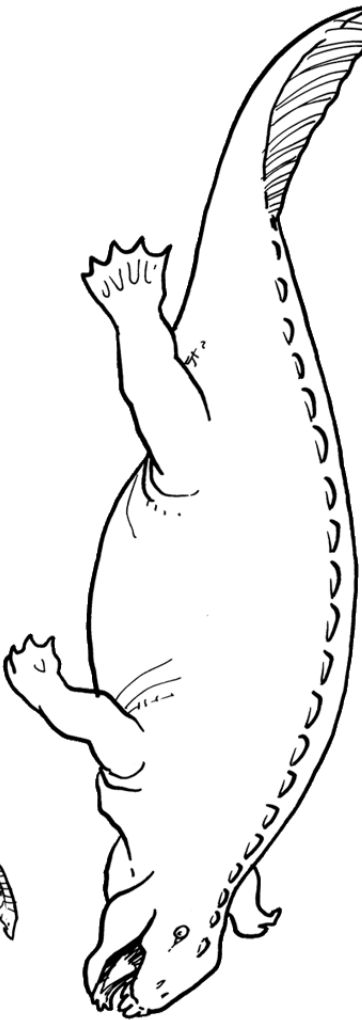
Placodus (2 m)

Nothosaurierna tros vara de allra första havslevan reptilerna. De levde troligen som nutida sälar och jagade och ägnade stor del av sina liv i vattnet, men gick troligen iland för att vila och lägga sina ägg.