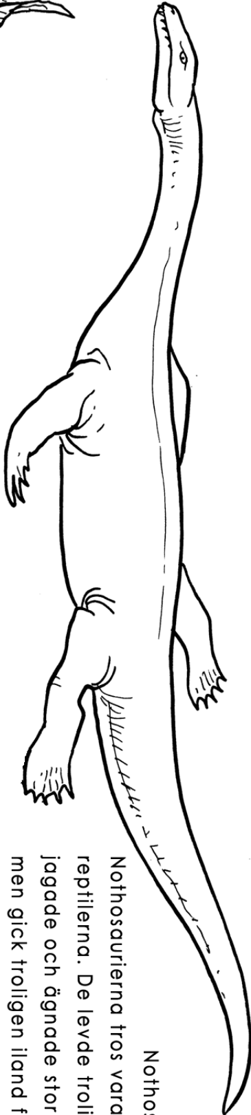
Nothosaurus (3 m)

Nothosaurierna tros vara de allra första havslevan reptilerna. De levde troligen som nutida sälar och jagade och ägnade stor del av sina liv i vattnet, men gick troligen iland för att vila och lägga sina ägg.