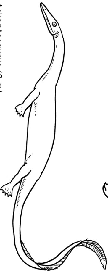
Askeptosaurus (2 m)

Placodus tillhörde placodonterna, ett släkte havslevande reptiler. De var klumpiga och levde i grunda hav. Placodonterna hade kraftiga käkar med långa, platta tänder, som användes till att krossa musslor och andra skaldjur.